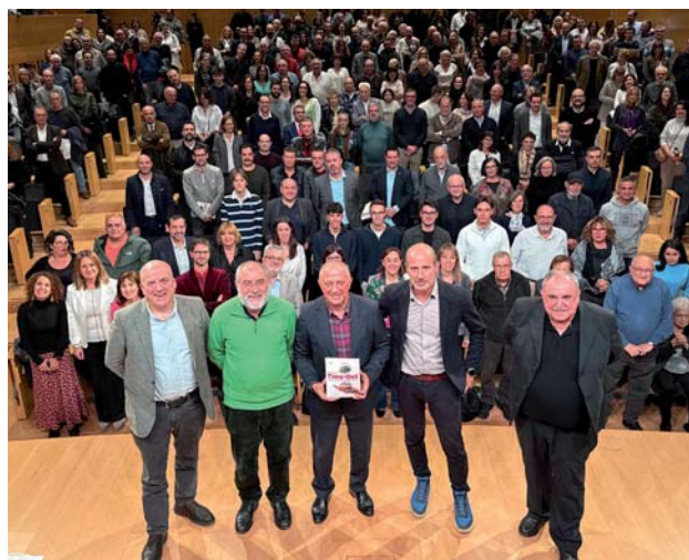
Momento de la presentación del libro en el Auditorio de Girona al que asistieron más de 400 personas.

Por ello, la idea es crear puentes y ayudar a que esas ideas atraviesen esa zona de muerte, analizando también por qué hay ideas y proyectos que no cruzan al otro lado o que lo alcanzan sin llegar