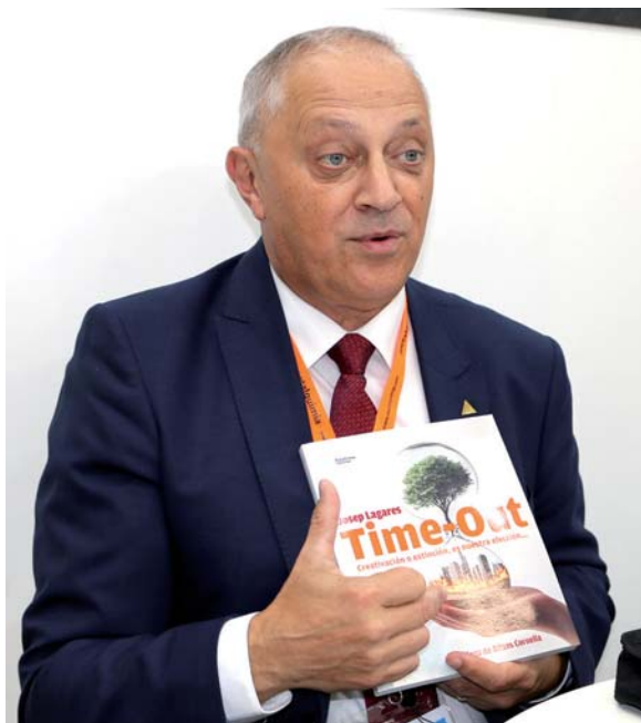
Momento de la presentación del libro Time-Out durante la pasada edición de IFFA con motivo de la tradicional rueda de prensa de Metalquimia en la que se muestran los lanzamientos de la compañía.

Sí. Al final del libro expongo otra visión que hace tiempo me hace reflexionar. Hay autores como Imma Martínez, por ejemplo, que en su obra La quinta revolución industrial , asegura que la conquista del espacio se va a convertir en la mayor expansión industrial en este siglo. A esta visión, ¡le he sumado un ejercicio de creatividad con otras muchas más cosas que conozco, derivando en un relato acerca de la colonización de un exoplaneta... pero hasta ahí puedo leer!